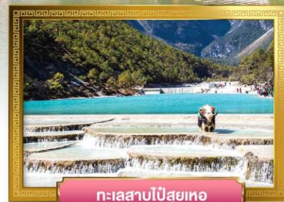
ทะเลสาบไป๋ส่วยเหอ