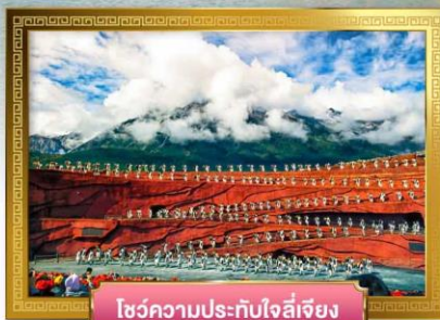
โซ่วความประทับใจลี้เจียง